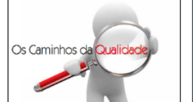
Os Caminhos da Qualidade