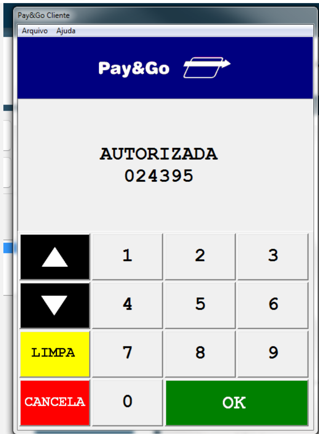
6 - Será impresso o comprovante TEF